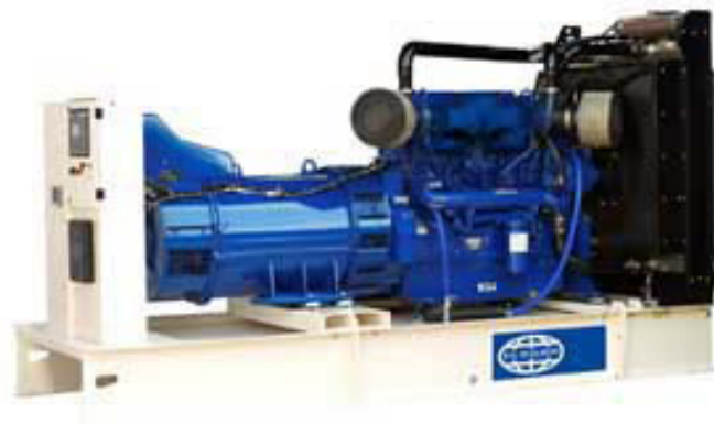
Imagen con finalidad ilustrativa únicamente